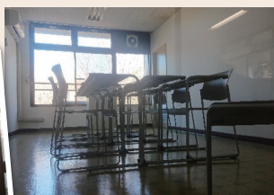
▲多目的ルーム 第2食堂▶